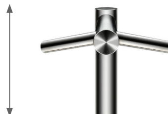
DYSON AIRBLADE AB09 TAP TALL DYS111