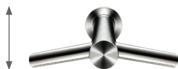
DYSON AIRBLADE AB11 TAP WALL DYSA11