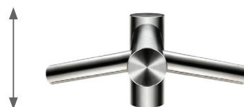
DYSON AIRBLADE AB09 TAP SHORT DYSAB9